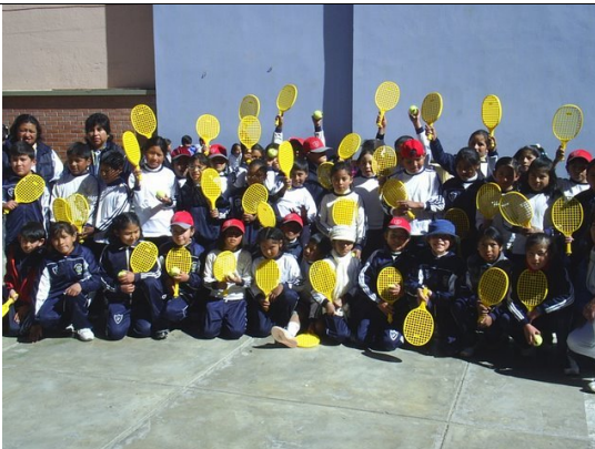
Participantes del Programa de Masificación en Oruro