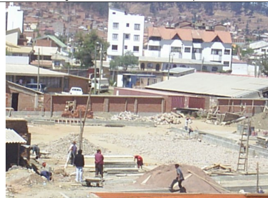
Complejo de tenis en La Madonna, Sucre en fase de construcción