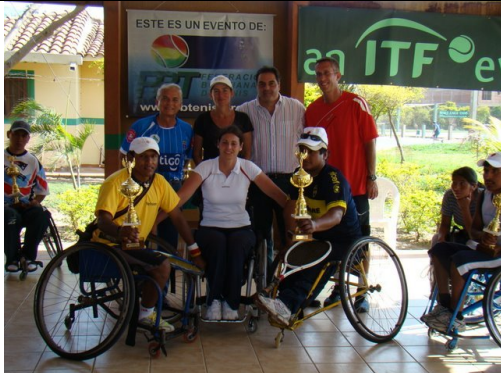
Premiación de torneo nacional en Silla de Ruedas