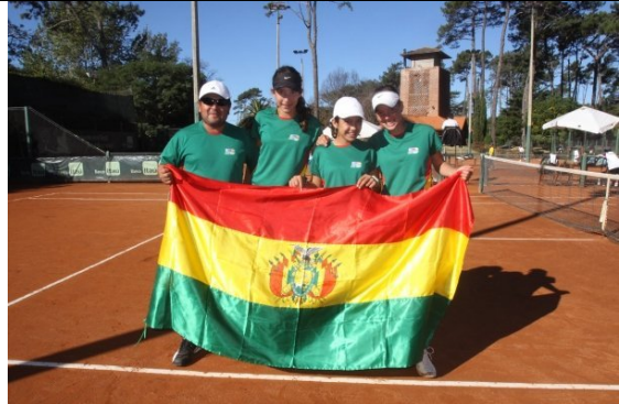
Equipo femenino de 14 años