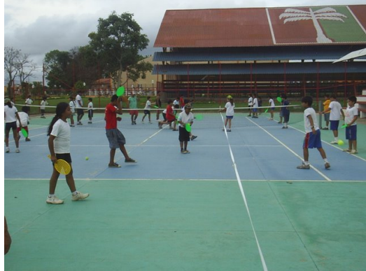
Torneo de Minitenis en Cobija, Pando