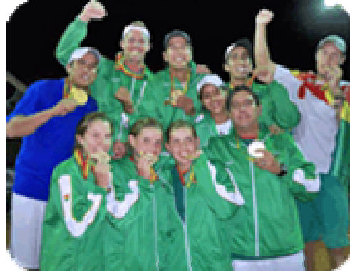
Equipo Bolivia que obtuvo 5 medallas de oro en los Juegos Bolivarianos de Sucre.