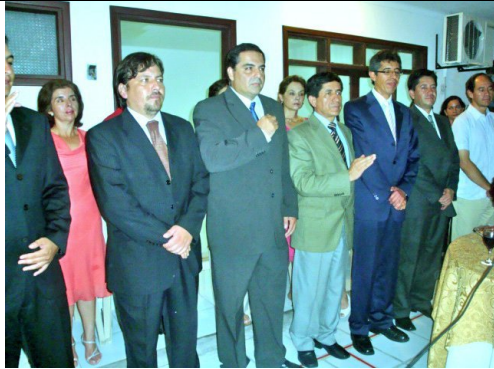
Posesión del Directorio