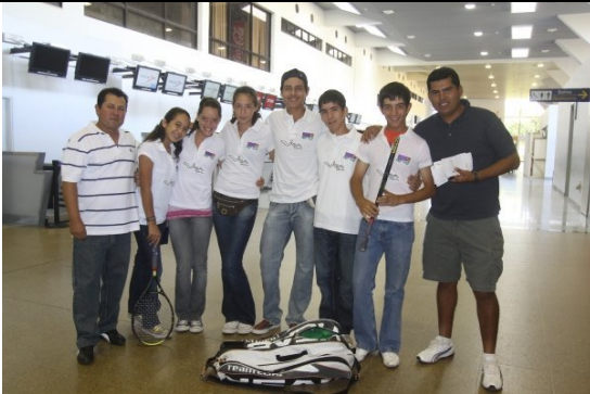
Equipo de damas y varones 14 años