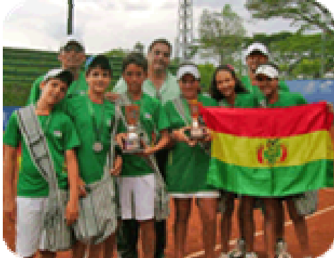
Equipo boliviano Sub 12 de damas y varones, con el Presidente de la FBT