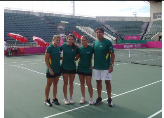
Equipo de Fed Cup