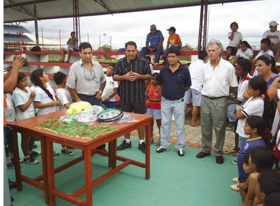
Premiación de torneo de masificación en Cobija, junto al Alcalde Municipal