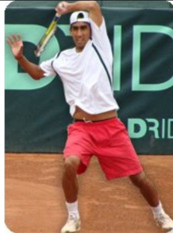
Mauricio Doria Medina