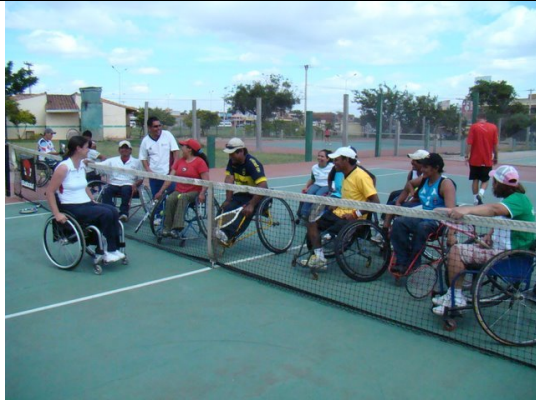
Workshop Nacional de Tenis en Silla de Ruedas